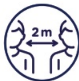
Keep your distance

Over the coming months, as long as the great majority of the population is not yet vaccinated, COVID-19 will remain.