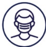
Cover your face