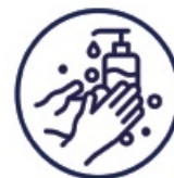
Wash your hands