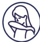
Cough into your sleeve