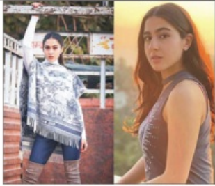
Sara Ali Khan has always been vocal about her mother Amrita Singh who has been close to her and she follows everything she says. Today in her interview she says that everything she does, she takes advice from her mother Amrita Singh whether it's about the films she does or about styling. She even adds a drawback to her mother's advice as it comes with a warning. Here's what she has to say to the daily, "Everything I do comes from my mother, whether it's styling or films. I bounce everything to her, but the irony of that statement is she has told me 'listen as your mother, I can tell you what I think, but ultimately the only thing you have to rely on is conviction. Eyes don't fail it, don't do it, whether it's the colour of your nail paint, the sheet you are

Sara Ali Khan has been working with some of the best directors and also getting a chance to romance some of the biggest superstars on the big screen. Today in one of her interviews with a leading daily, Sara Ali Khan talks about her support system - her mother Amrita Singh.