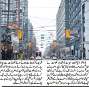
اوجاڑی حکومت کی ایمریشن میں مزید 30 دن کی توسیع۔