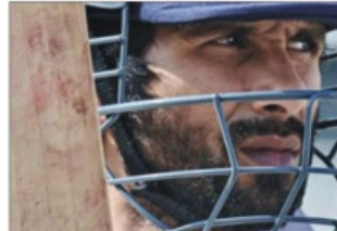
Shahid Kapoor took to his social media account to make a big announcement about his next jersey. The actor released a picture from the film where he was seen in a cricketor avatar and the actor announced the release date of the film. Jersey will have a theatrical release and it will hit the screens on Diwali this year.

Earlier Diwali and festival releases used to be something to look forward to. But due to the pandemic, all the releases have gone haywire and despite the news of the vaccination, we have no news about some big festival releases. But it looks like Shahid Kapoor and team Jersey are ready to put a smile on our faces this Diwali.