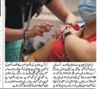
اوجاڑی حکومت آگ تک سب کی کچی ٹیٹن چاہتی ہے جیزل۔