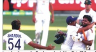
Rishabh Pant was just an away from smashing the 1000-run mark in Test cricket when he came to bat on Tuesday. Pant, who played a career-defining knock here, became the fastest Indian wicketkeeper to reach the 1000-run mark. The Southpaw took just 27 innings surpassing MS Dhoni's 32 innings record.

India pulled off a historic three-wicket win at Gabba on Tuesday thanks to Rishabh Pant's unbeaten 89-run knock which helped India realize the dream of an outright series win. The win at the Gabba on the final day means that India have won an unprecedented back-to-back Test series Down Under.