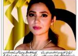
میری ٹی فلمیں فلم انٹرنی کوئی زندگی میں گئی ماہرہ خان

کوئی فلم کی ویڈیو سے مزید انٹرنی برائی کیت کا کارڈ ہوگا