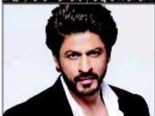
شاہ رخ خان کی فلم 'پہاں' میں اچانک نظر آئیں گے

شاہ رخ خان نے زندگی کی 55 بھاری دیکھ لیں شاہ رخ خان جلد ہی اپنی فلم 'پہاں' میں اچانک نظر آئیں گے