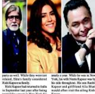
Amitabh Bachchan and Ekta Kapoor.

Amitabh Bachchan and Ekta Kapoor have decided to cancel their Diwali parties this year in memory of Rishi Kapoor. Rishi Kapoor passed away on October 31st.