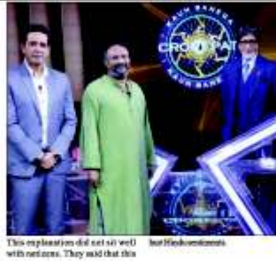
This explanation did not sit well with netizens. They said that this...

Amitabh Bachchan, who recently returned to work with KBC's 12th season, has been the center of a controversy. An FIR has been filed in Lucknow against the makers of KBC 12 and Amitabh Bachchan for having asked questions related to Manusmriti and Dr BR Ambedkar.