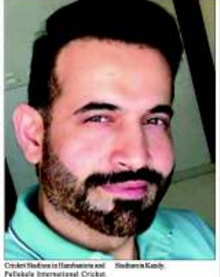
Irfan Pathan in his Kandy franchise uniform.

Former India pace bowler Irfan Pathan has joined the Kandy franchise in the Lanka Premier League (LPL). He will be playing for the Kandy franchise in the upcoming season.