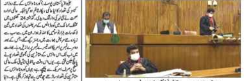
انڈیا میں کوئی شہر دنیا بھر میں ریڈ کروہ سے محفوظ نہیں ہے۔

سب سے زیادہ خطرہ شمالی بھارت میں ہے جہاں تیسرے نمبر پر ایک روز میں 5500 افراد ہلاک ہوئے۔