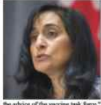
the advice of the vaccine task force," Public Services and Procurement Minister Anita Anand said Monday morning when asked whether her government would continue pursuing deals with China.

The federal cabinet minister responsible for purchasing Canada's vaccine supply is not ruling out buying from China or Chinese companies, despite an earlier development partnership that fell apart because China's customs wouldn't allow a vaccine candidate to be shipped to Canada. The now-scrapped arrangement with Chinese vaccine developer CanSino would have made the company's fast-progressing vaccine candidate against COVID-19 the first to be approved for testing in human trials in a Canadian lab. Had it been approved for use in Canada, CanSino would have allowed Canada to manufacture it domestically for nearby Canadians. The deal fell apart after China's customs delayed the shipment of initial samples to Canada for months. Since then, Canada has struck deals with four American companies for tens of millions of doses of their still in-trial COVID-19 vaccines. "Our vaccine negotiations are proceeding with multiple companies at the current time and primarily on