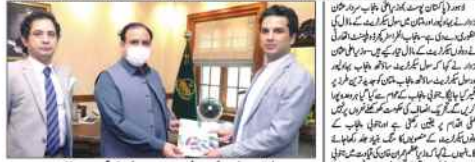
نیشنل ایئر لائنز کے چیف نے کہا کہ پاکستانی حکومت کو طعنے لگتے ہوئے۔