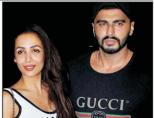
is an attitude we love. On the work front, Malaika is pretty occupied with reality tv in which she's often plays judge. She also runs a yoga studio and a fashion label.

Recently during an interview with a leading portal, the actress opened up about the negative things being spoken about her. She said that one needs to get used to this whole prospect if they are in this business and are a celebrity. She also said that everyone will be scrutinised for anything they do. Now that certainly