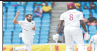
defiance of Cummins, who hung around with Holder for an hour-and-a-half without getting off the mark. When the partnership was finally broken - Holder caught behind off Mohammed Shami for 39 - Cummins saw his man Shannon Gabriel pick up two singles immediately.

Having slipped from 174 to five to 179 for eight late on day two courtesy of the persistent Ishant Sharma, India would have been expected to finish the job swiftly at the start of play. However, they did not count on the